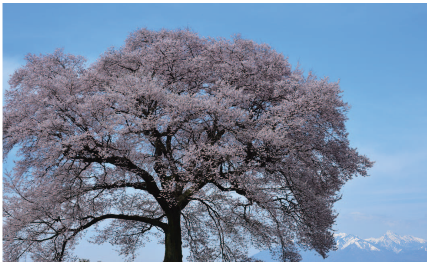
今月の写真 桐生ロータリークラブ 山崎一順 わに塚の桜 (山梨県韮崎市)