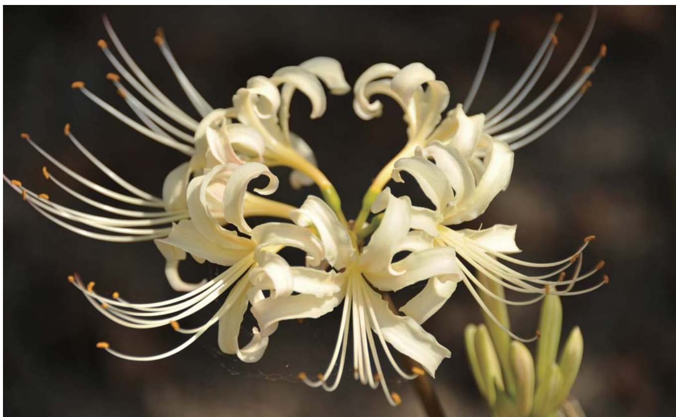
今月の写真 桐生ロータリークラブ 山崎一順 (白い彼岸花 桐生川にて)