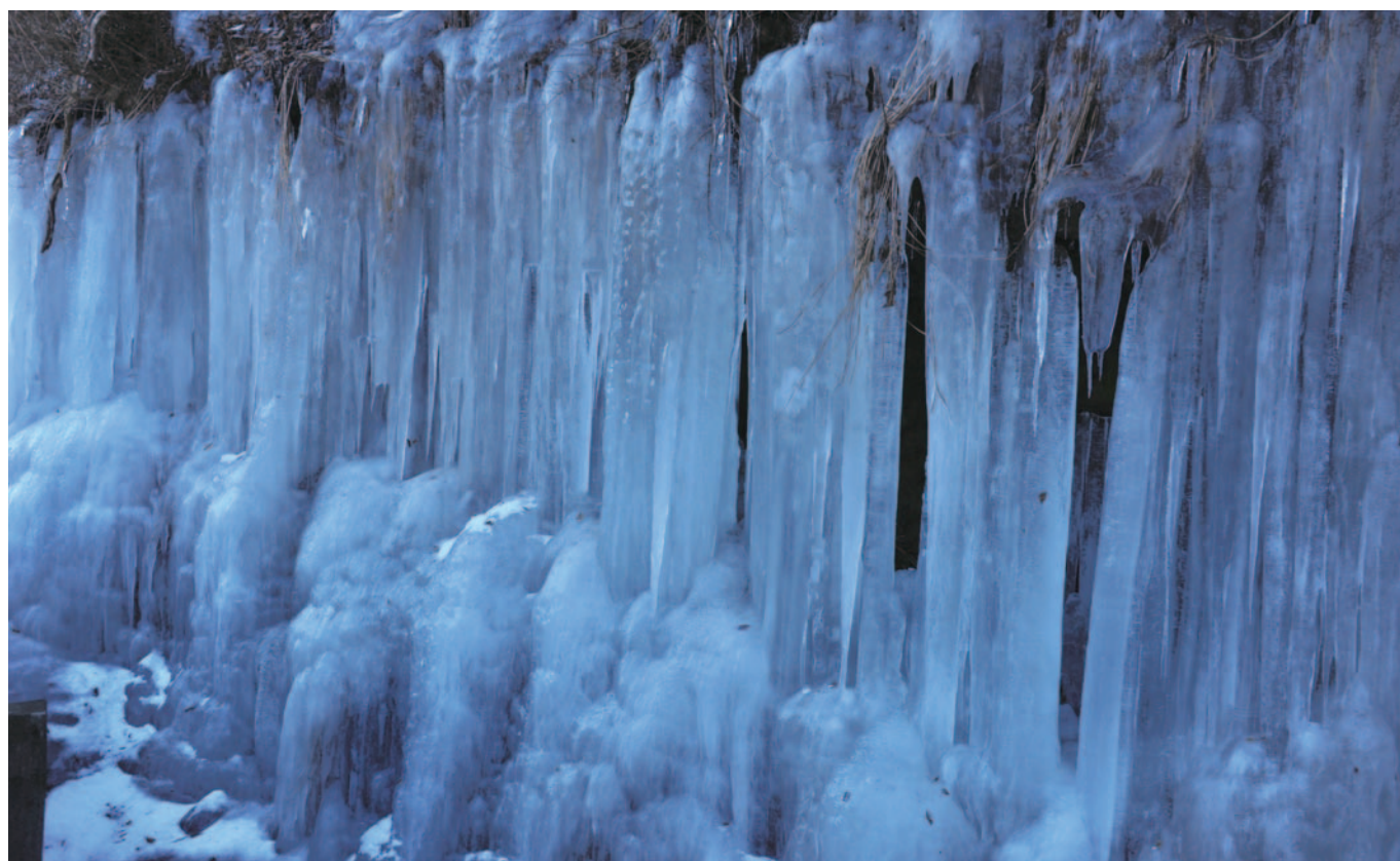
今月の写真 桐生ロータリークラブ 山崎一順 (桐生市新里町にて)