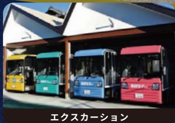
エクスカーション

〒376-0024 群馬県桐生市織姫町 2-5 TEL : 0277-40-1500