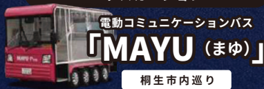
電動コミュニケーションバス 「MAYU (まゆ)」