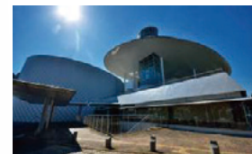
■美喜仁桐生文化会館

著書： 『石原家の人々』 『あそびに行こうよコール』 『石原良純のこんなに楽しい気象予報士』