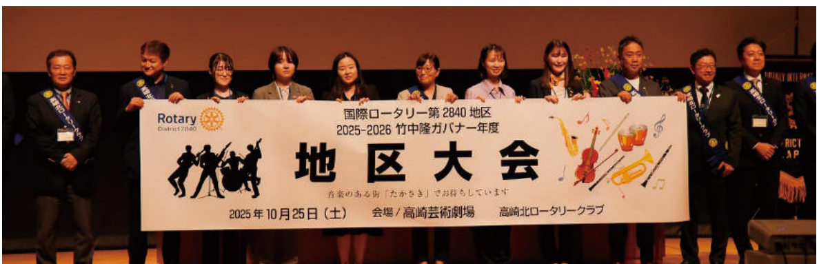
2025-2026年度 地区大会 (高崎北RC)