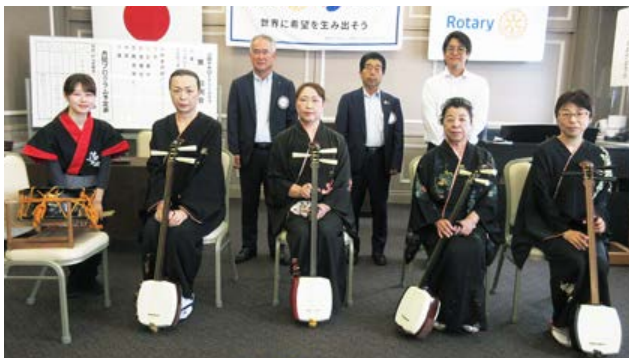
すずゆうかい 津軽三味線 鈴友会の皆様