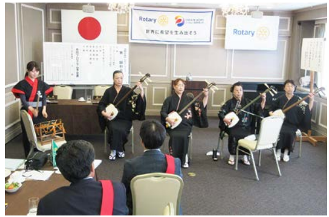
津軽三味線 鈴友会の皆様

本日は会員組織強化委員会の担当卓話で、津軽三味線の鈴友会の皆様にお越し頂きました。誠にありがとうございます。演奏楽しみにしております。