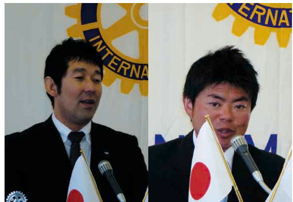
■沼田青年会議所よりお知らせ

28年ロータリーに入っていて、この体験は本当によかったと思えました。来年はインドでの投与が最後となるかもしれません。帰国する時に団長から、また来年も来てくれる方と言われ、手を挙げました。次回は、我クラブからも何人か誘って行きたいと思いません。