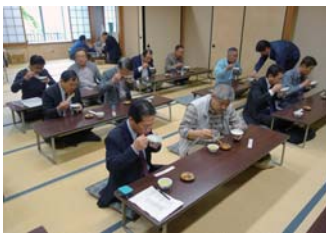
写経後の朝がゆは とてもおいしいのです