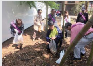
実際に活動している証拠画像