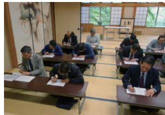
日頃の悪業を払うべく一心不乱に写経に取り組むメンバー