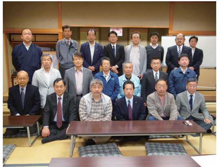
写経功德の有効期間は、おそらく今日一日だけ。 今のところ光り輝いています。