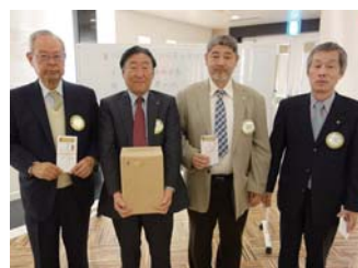
奥様お誕生日祝いの方々はみな恐妻家?