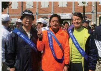
参加した3名の証拠画像