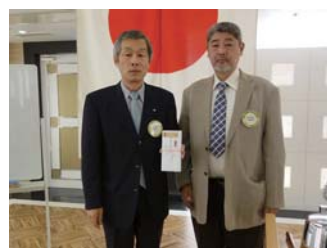
お誕生日祝いは吉村直前