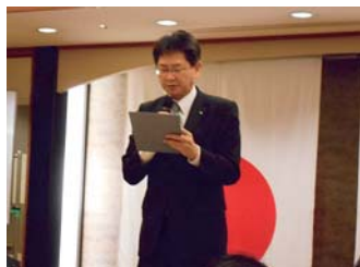
ニコニコBOX報告 浜辺ニコニコBOX委員長