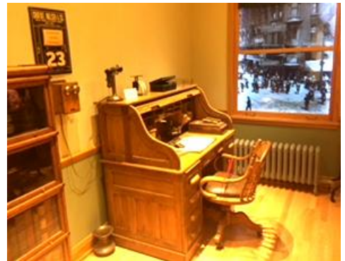
シカゴ・ロータリー本部内のポール・ハリス像と 当時の弁護士事務所復元写真