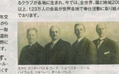
ロータリーが各地に生まれ、今では、全世界、国と地域200以上、123万人の会員が世界各地で奉仕活動に取り組んでいます。