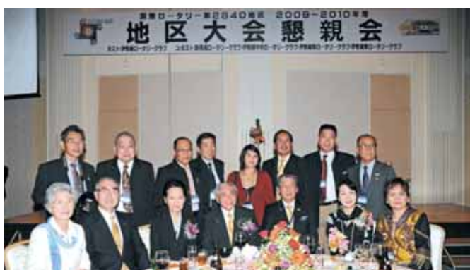
【板橋RI会長代理ご夫妻を囲んでフィリピンからのロータリアン】