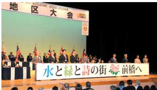
【次年度開催地 前橋西RC発表】