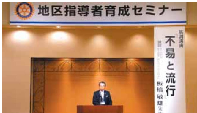
【牛久保ガバナー 挨拶】