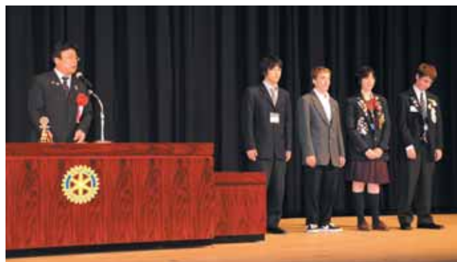
【青少年交換委員長より交換学生の紹介】