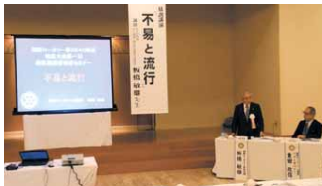
【板橋RI会長代理 基調講演】