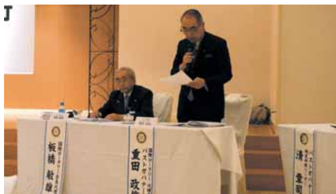
【RI元理事 重田パストガバナー】