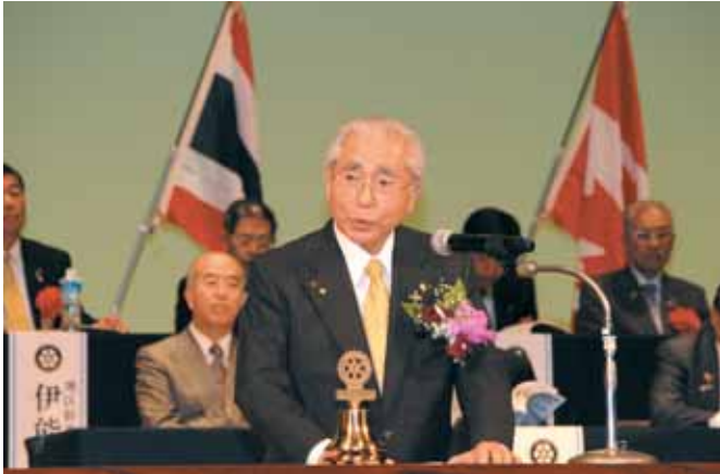
【板橋RI会長代理 講話】

昼食会場は伊勢崎市文化会館隣りのプリオパレスに移動となり昼食会場での交流も深める事が出来たと思います。