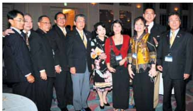
【牛久保ガバナー夫妻とフィリピンからのロータリアン】