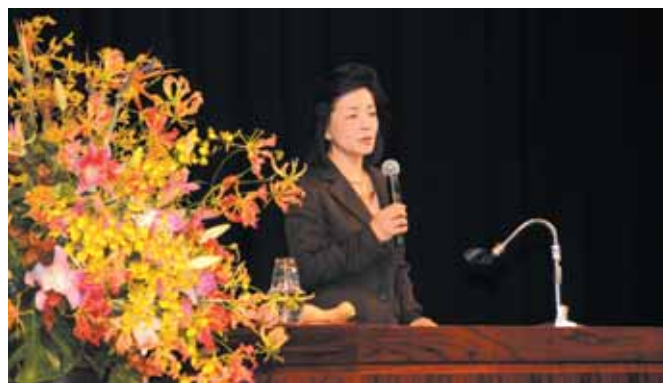
【特別記念講演 ジャーナリスト櫻井よし子先生】