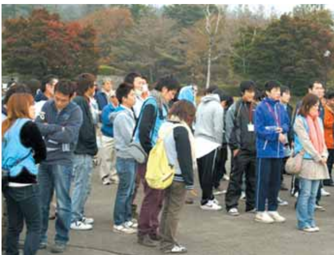
【オリエンテーリング】