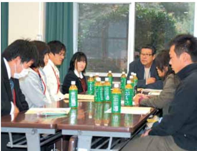
【グループディスカッション】