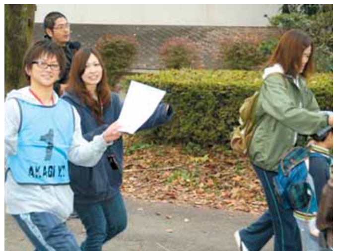
【オリエンテーリング】