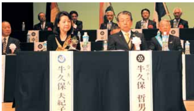
【牛久保ガバナーご夫妻】