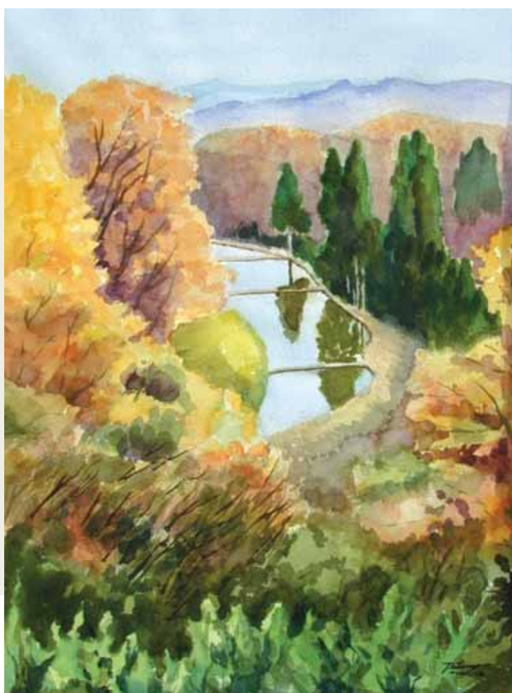
今月の絵画 ● 棚田暮色 〈水彩〉20号 ガバナー 牛久保哲男 / 画