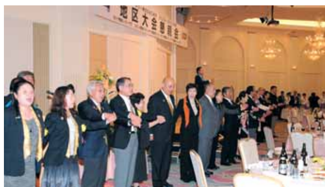
【大懇親会フィナーレ『手に手つないで』を合唱】