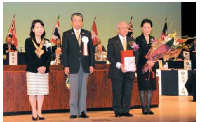
【牛久保ガバナー夫妻より板橋RI会長代理に記念品贈呈】