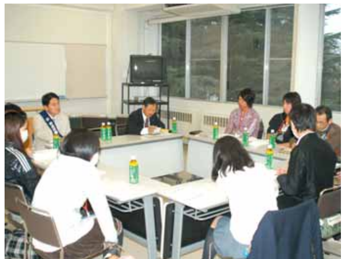
【グループディスカッション】