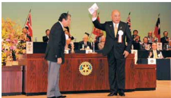
【牛久保ガバナーより松倉直前ガバナーへ記念品】