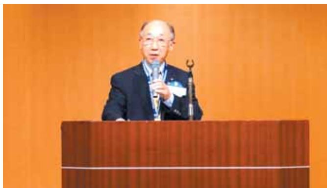
【研修リーダー 清パストガバナー】