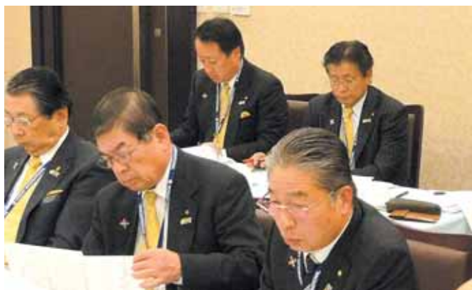
【地区幹事より議案説明】