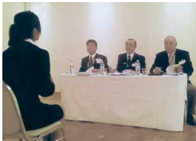
【選考委員による面接/Cグループ】