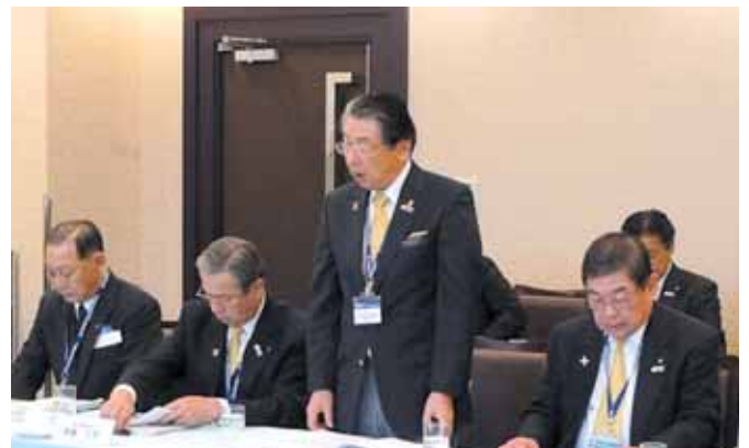
【牛久保ガバナー挨拶】