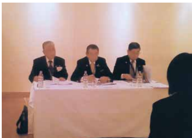
【選考委員による面接/Aグループ】

10時20分より3組の面接グループに別れ、応募学生の面接が実施されました。本年度は県内大学7校より39名の応募がありましたが、当日2名の欠席者がおりましたので実質37名の面接試験を行ないました。面接に望んだ学生の皆さんは緊張した様子で面接委員の質問に真剣に受け答えをしておりました。面接時間は1人15分間、午前中19名、午後18名で2時45分に修了しました。3時より4時30分まで選考委員会が開催され、慎重な審査の結果15名の合格者及び3名の補欠者を下記の様に決定いたしました。