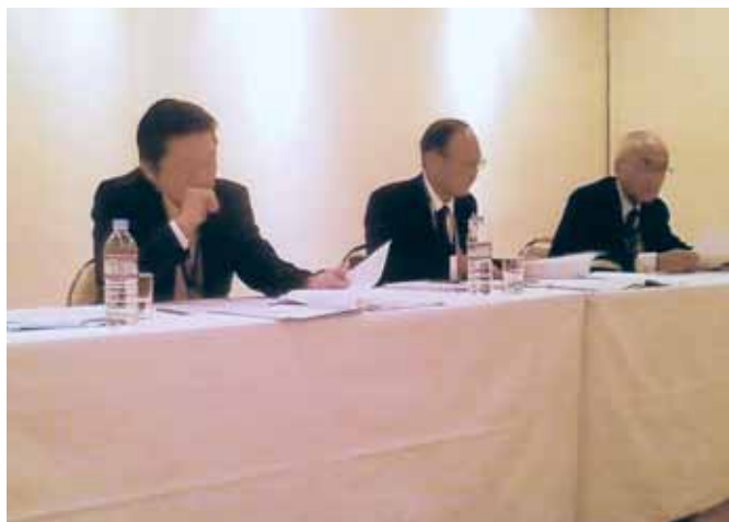
【選考委員による面接/Bグループ】