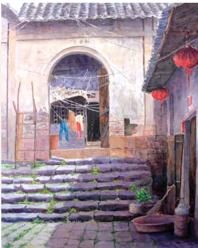
今月の絵画 ●鳳凰城にて[中国 湖南省] <水彩>40号 ガバナー 牛久保哲男/画