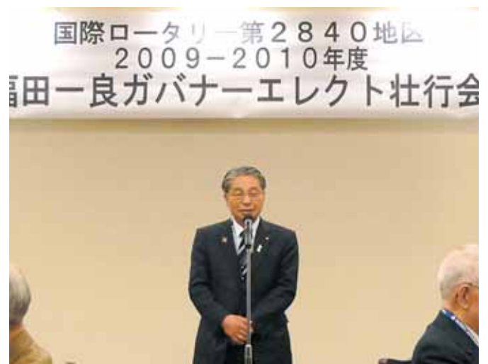
【福田GEより決意表明】