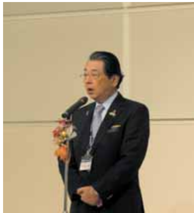
【牛久保ガバナーあいさつ】

このように楽しいクリスマス会を催す事が出来たのも、ホストクラブ(前橋RC・高崎東RC・安中RC)の皆様方、そしてホストファミリーの皆様方のおかげと感謝申し上げます。これからもよろしく願いいたします。