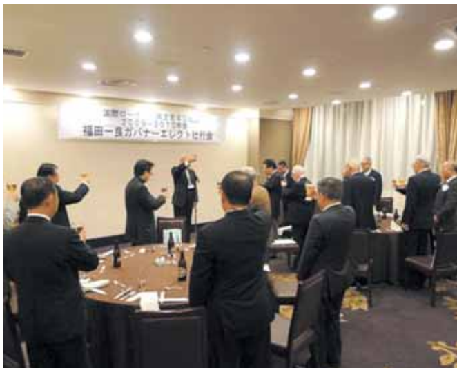
【松倉直前ガバナーによる乾杯】