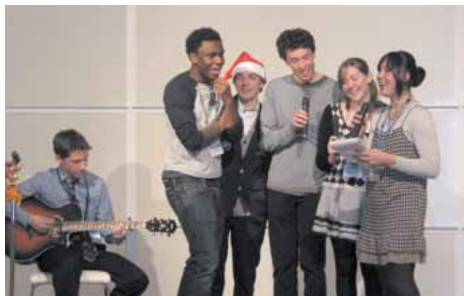
【交換学生・お友達による歌】