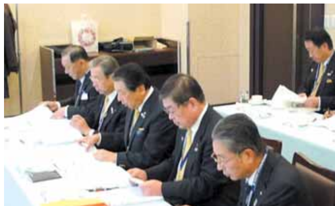
【牛久保ガバナーより報告】