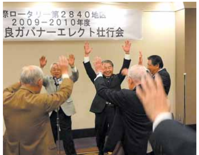
【横山バストガバナーによる締め挨拶】