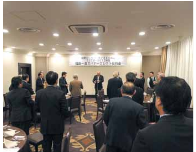
【福田ガバナーエレクトへ松倉直前ガバナーからの挨拶】